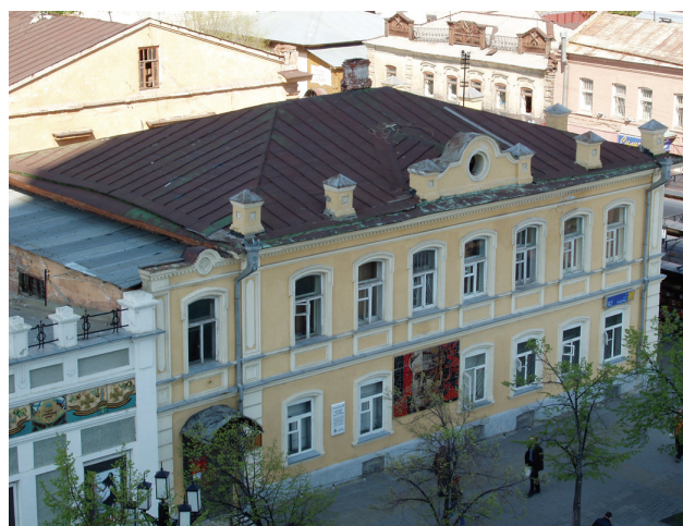
Фото: Е. Ф. Зинченко

Ист.: Челябинск : энциклопедия; Министерство культуры Челябинской области. http://mk74.rf .